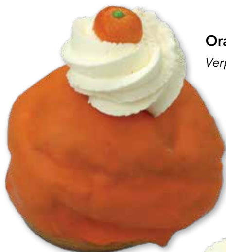
Oranje Soes Midi 18938