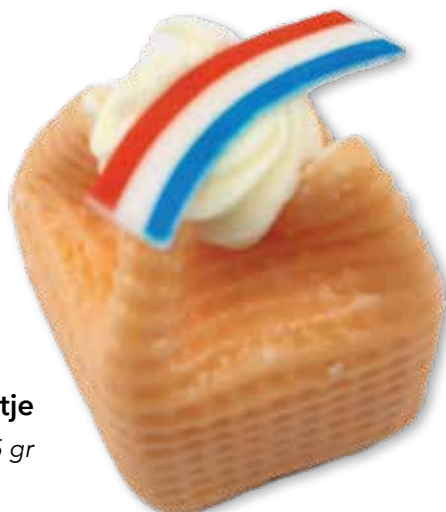
12109 Oranje Kasteeltje