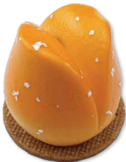
Oranje Tulp 18467

Dessertgebakje van passie mousse, compote mandarijn en boterdeegbiscuit. Ook leuk voor tijdens de EK wedstrijden.