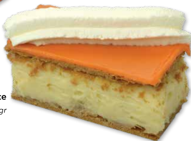
18937 Oranje Tompouce